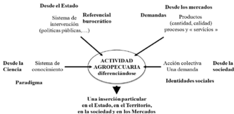
Figura 5: Un modelo de desarrollo es una cuádruple convergencia

Estos modelos son emergentes y como tales son incompletos, inacabados. Esa propiedad de “incompletud” no es el resultado de un estado de transición de un territorio a otro según el concepto de de/re-territorialización de un geógrafo como Claude Raffestin (1987). Parece definir más bien un estado inestable pero prolongado, permanentemente en cambio y con modelos que, aunque ni siquiera bien definidos, ya están en disputa. Lo llamé una “territorialización incompleta” con la finalidad de llevar el foco de atención de los