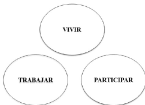
Figura 2: Configuraciones de la noción de actividad