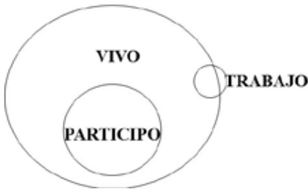
Figura 3: Mediación “tradicional”