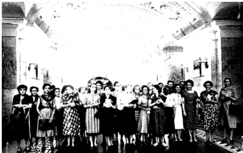
“Las delegadas visitaron el Metropolitano de Moscú. En la foto las delegadas en la estación Kaluzhskaya” 389 .

Estos ejemplos ilustrativos desde la fotografía se constituyeron como una herramienta de gran importancia que otorgaba a la policía la posibilidad de individualizar a las personas. En este caso, durante todo el legajo, solo se marcó a las dos militantes indicadas al principio. El recurso fotográfico fue históricamente un instrumento de detección “criminal” utilizado por la policía desde su conformación hasta la actualidad. Como se explicó en el capítulo I, estos métodos además de introducir la técnica en la “persecución del delito”, estuvieron atravesados por una impronta ideológica y criminológica que inducía a priori a determinar quiénes eran “peligroso/as” para la sociedad y en la dimensión política del delito quiénes perturbaban la identidad nacional 390 .