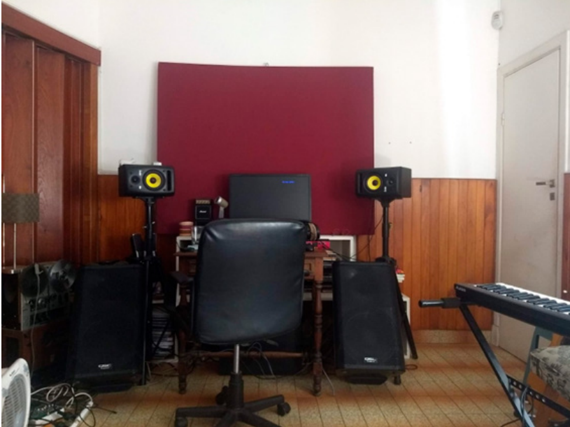
Home Studio. Villa Elisa (mayo de 2015).

Ahora bien, si tuviera que sintetizar, considerando toda la discusión precedente, qué es un sello musical gestionado entre amigos y por qué es importante retener su novedad relativa, diría que se trata de una institución que reúne y hace trabajar recursos, intereses, tecnologías, espacios, amistades, competencias, entrenamientos, compromisos y, entre otros elementos, búsquedas estéticas. En otras palabras, el sello es a la vez una