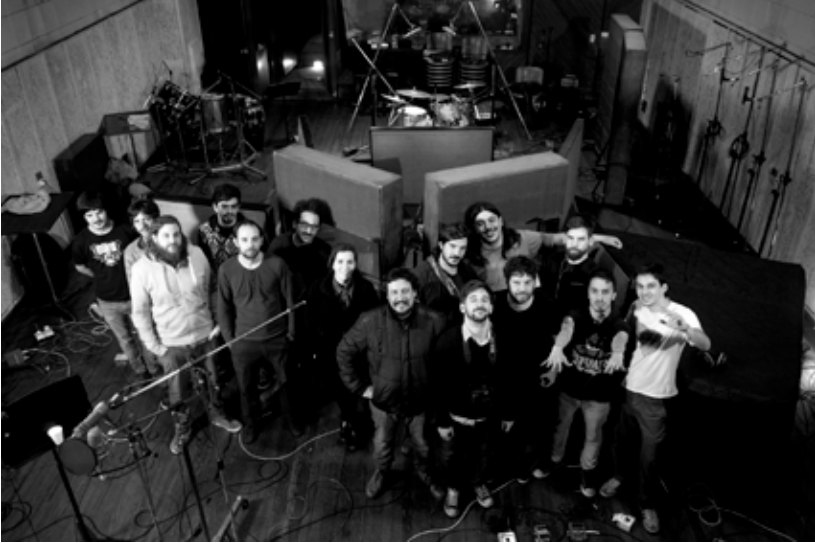
Equipo y amigos/as en la grabación del disco Sueño Real , Shaman y Los Pilares de la Creación. Estudios Ion, CABA (noviembre de 2014).