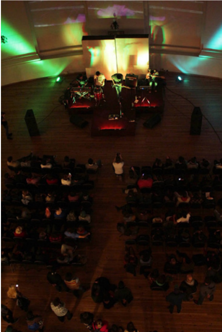
7. Un Planeta en la 15 edición del ciclo Sonido expansivo. Anexo del Senado de la Provincia de Buenos Aires, La Plata (mayo de 2014).

Nicolás y Cristóbal aprovecharon este espacio y los recursos monetarios que la Dirección les otorgaba por cada evento realizado para conectar con las bandas y sellos que les interesaban.