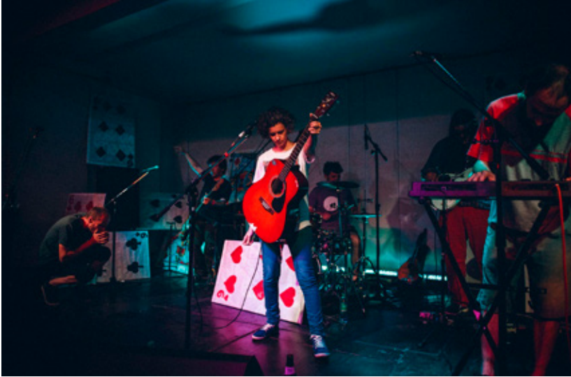
Presentación de Sr. Tomate. Centro Cultural Matienzo, CABA (5 de diciembre de 2015).