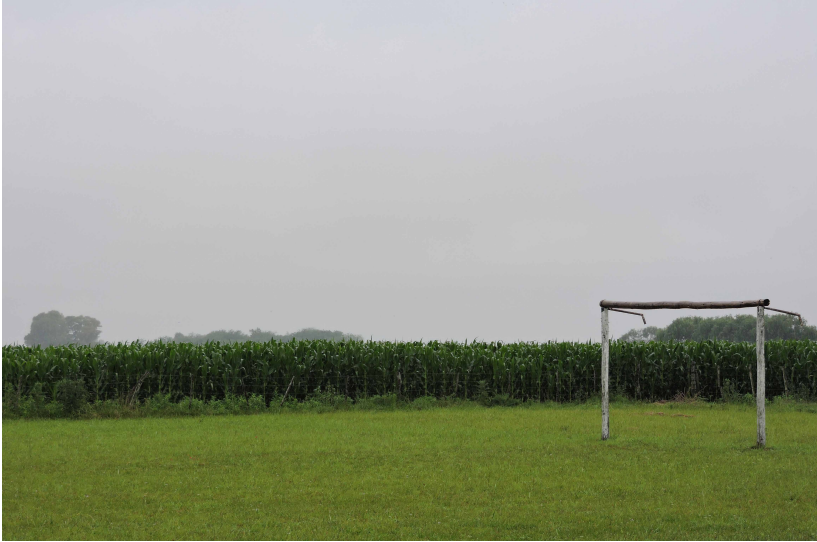
Foto tomada en una escuela rural de Entre Ríos, en el marco de un relevamiento ambiental realizado para dos trabajos finales de grado y uno extensionista de EMISA (FCE-UNLP), en conjunto con la campaña “Paren de Fumigar las Escuelas” de AGMER (Asociación del Magisterio de Entre Ríos). En el patio de la escuela, el cerco de la cancha de fútbol es un campo de maíz. Estos cultivos son fumigados con frecuencia, muchas veces en horario de clase. ¿A qué nos podemos acostumbrar? ¡Paren de fumigar las escuelas!