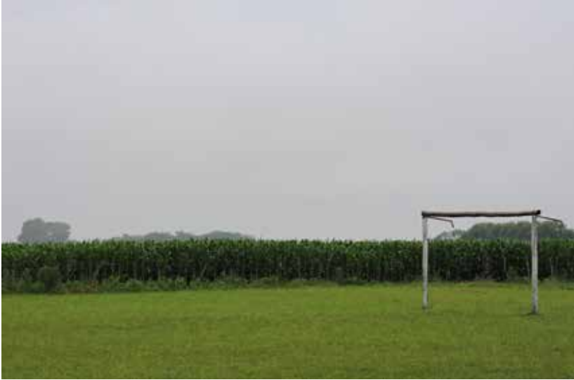
Foto tomada en una escuela rural de Entre Ríos, en el marco de un relevamiento ambiental realizado para dos trabajos finales de grado y uno extensionista de EMISA (FCE-UNLP), en conjunto con la campaña “Paren de Fumigar las Escuelas” de AGMER (Asociación del Magisterio de Entre Ríos). En el patio de la escuela, el cerco de la cancha de fútbol es un campo de maíz. Estos cultivos son fumigados con frecuencia, muchas veces en horario de clase. ¿A qué nos podemos acostumbrar? ¡Paren de fumigar las escuelas!