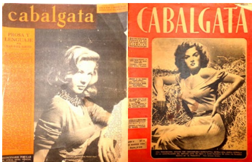
Figuras 2 y 3. Portada del número 7 de Cabalgata (14 de enero de 1947) y portada del número 12 de Cabalgata (25 de marzo de 1947)