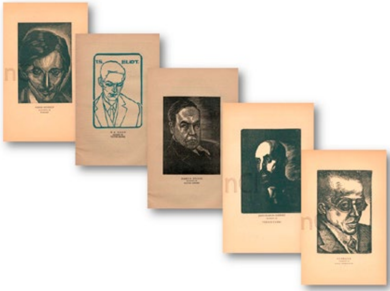
Grabados de Pierre Reverdy, T.S. Eliot, Rubén Darío, Juan Ramón Jiménez y Klabund en Poesía .

En la selección de los autores retratados encontramos la intención de priorizar a los extranjeros por sobre los colaboradores argentinos que pocos años antes habían conformado la “nueva sensibilidad”. Se publicaron grabados de los poetas Pierre Reverdy, T.S. Eliot, Rubén Darío, Juan Ramón Jiménez y Klabund. Este aspecto, entre otros, deja ver que el trabajo de conservación no se limitaba al campo literario nacional sino que expandía sus límites y priorizaba la presentación de los escritores foráneos, algunos de ellos bien conocidos por el lector argentino, como sucedía con Rubén Darío. Las ilustraciones más importantes de la revista, por ser las de mayor tamaño, no se vincularon semánticamente con el texto que acompañaban sino que tenían como función presentar visualmente a un poeta. En este caso, como en todos aquellos