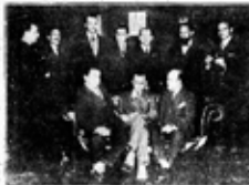
UNA REUNIÓN DE LA VIDA LITERARIA

En el campo de la literatura, el año 1929 ha sido un año de gran fecundidad. En el campo de la crítica, el año 1929 ha sido un año de gran actividad. En el campo de la enseñanza, el año 1929 ha sido un año de gran actividad.