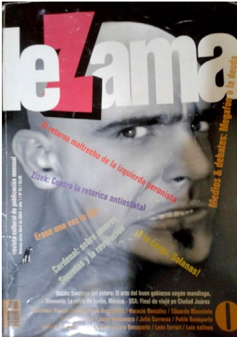
Figura 1: “Crispación”. Portada del primer número de Lezama , nº 1, abril de 2004

La portada del número 1 de Lezama es, a simple vista, toda una interpelación (figura 1):