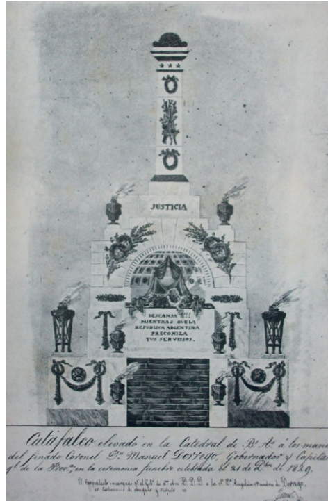
Archivo del Museo Histórico Nacional. Reproducción en blanco y negro del original (en colores), en Bucich (1928, p. 33).

Arribada la procesión al templo, comenzaron los oficios religiosos. El elogio fúnebre, pronunciado por el doctor Figueredo, reflejó el profundo significado político que adquirirían los funerales del difunto gobernador. El cura no solo pronunció una extensa sucesión de alabanzas hacia el fallecido, plagada de analogías bíblicas, sino que emprendió además una acalorada defensa de su accionar político. Fustigó también en duros términos a sus enemigos, tiranos que “fundaron su gobierno sobre un cadalso” (Figueredo, 1830, p. 21). Incluso se permitió, veladamente, aludir a la figura del flamante gobernador, aquel “gefe virtuoso y valiente, que el Cielo conserva como la columna más fuerte de nuestro edificio político” (p. 15).